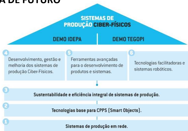
Figura 1 - Estrutura do Projeto

ASSOCIAÇÃO CCG/ZGDV, AZEVEDOS INDÚSTRIA, BRESIMAR AUTOMAÇÃO, BTL, CATIM, CEI, CENTIMFE, CITEVE, COLEP PACKAGING, CONTROLAR, CRITICAL MANUFACTURING, CTCOR, CTCV, CTIC, FELINO, FLOWMAT, IDEPA, INDEVE, INEGI, INESC TEC, INL, INOCAM, IPCB, IPL, IPS, IST, ISQ, JPM, MCG, MC SHARED SERVICES, S.A., MICROPROCESSADOR, MOTOFIL ROBOTICS, NEADVANCE, PINTO BRASIL RENOVÁVEIS, RIBERMOLD, SARKKIS ROBOTICS, SILAMPOS, SIRMAF, SISTRADE, SOFTI9, TALUS ROBOTICS, UA, UC, UP, VALINOX, VANGUARDA