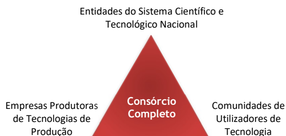
Figura 2 – Triângulo Virtuoso da Inovação Tecnológica